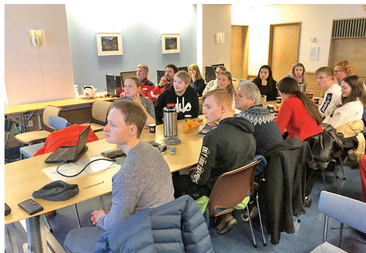
Elevar og leiarar følgjer med på dei ulike presentasjonane.